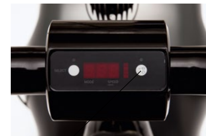
2. Taster rechts (ON/OFF) betätigen